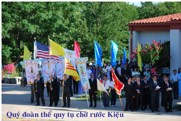
Quý đoàn thể quy tụ chờ rước Kiệu

Kiệu Đức Mẹ do Đoàn Thanh Niên đảm trách