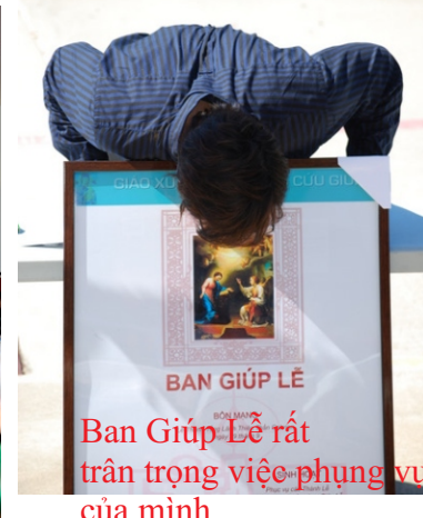
Ban Giúp Lễ rất trân trọng việc phụng vụ của mình