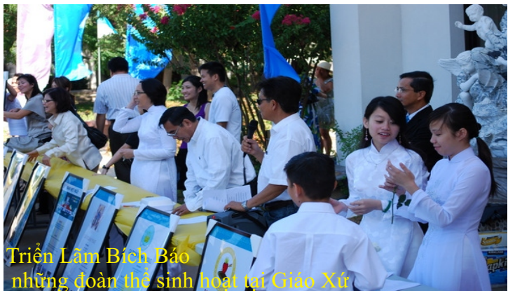
Triển Lãm Bích Báo những đoàn thể sinh hoạt tại Giáo Xứ

Nếu muốn xem thêm những Hình Ảnh chi tiết của ngày lễ Bổn Mạng giáo xứ, xin mời quý vị ghé thăm Trang Nhà www.dmheg.org , mục Tin Tức/Giáo Xứ/ Hình ảnh Lễ Đức Mẹ Hằng Cứu Giúp - Bổn Mạng Giáo Xứ