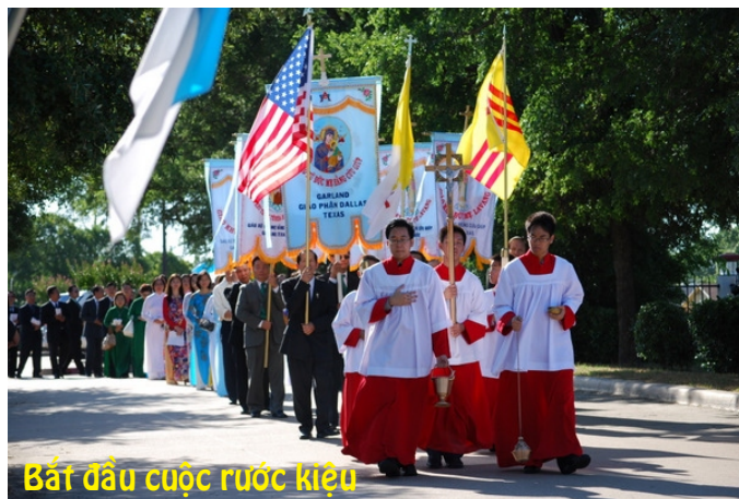
Bắt đầu cuộc rước kiệu

Điều mong ước rằng, sau khi quý vị đã tham quan về những sinh hoạt của giáo xứ, qua cuộc triển lãm này, quý vị có thể tìm thấy một đoàn thể thích hợp để cho mình tham gia và hoạt động, vì qua đoàn thể là những sợi giây liên kết chúng ta sống trong tinh thần cộng đồng xã hội để phục vụ Giáo Hội. Kết thúc buổi lễ, mọi người dự bữa cơm trưa thanh đạm do Giáo xứ và Hội Đức Mẹ Hằng Cứu Giúp khoản đãi.