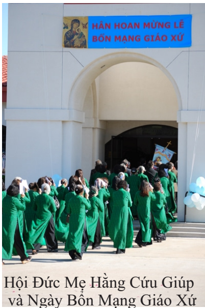
Hội Đức Mẹ Hằng Cứu Giúp và Ngày Bổn Mạng Giáo Xứ