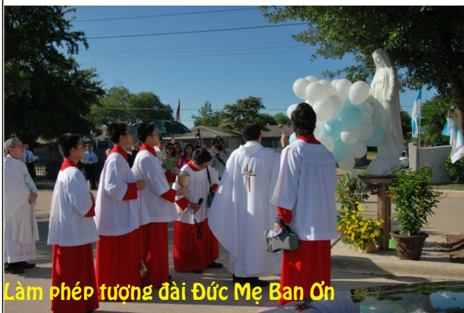
Làm phép tượng đài Đức Mẹ Ban Ôn