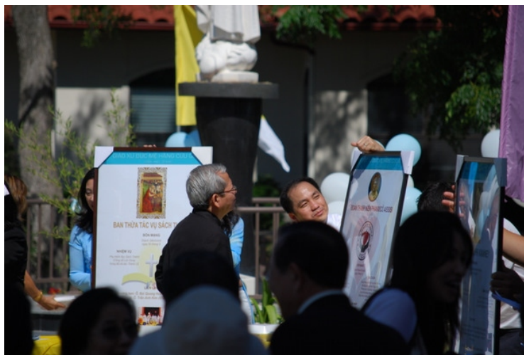
Cha Phó xứ đạo một vòng khích lệ