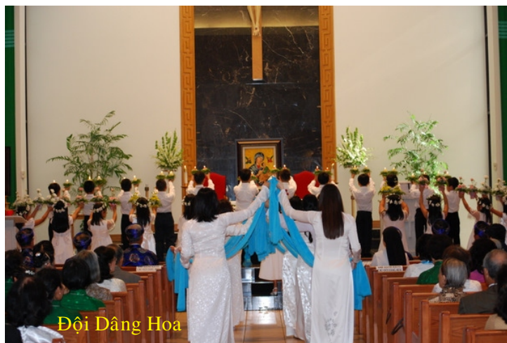
Đội Dâng Hoa

Nếu muốn xem thêm những Hình Ảnh chi tiết của ngày lễ Bổn Mạng giáo xứ, xin mời quý vị ghé thăm Trang Nhà www.dmheg.org , mục Tin Tức/Giáo Xứ/ Hình ảnh Lễ Đức Mẹ Hằng Cứu Giúp - Bổn Mạng Giáo Xứ