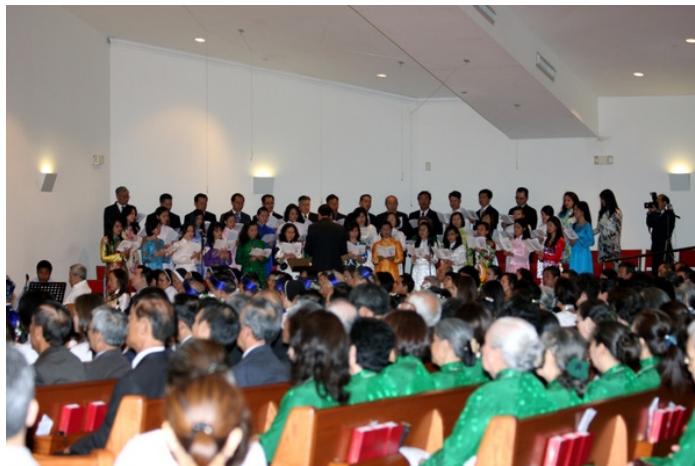
Ca Đoàn tổng Hợp và giáo dân tham dự