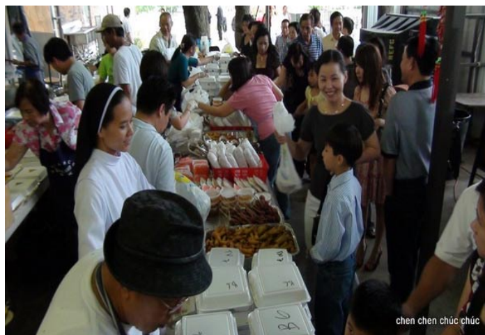
chen chen chúc chúc