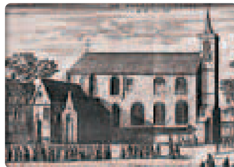
Nhà nguyện đầu tiên ở Beghine, 1397