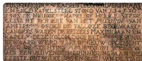
Tấm bia tường thuật về Phép lạ