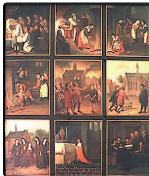
Chín tấm tranh họa do C. Schenk miêu tả diễn tiến Phép lạ

◀ Đọc thêm chi tiết về Phép lạ Amsterdam theo đường link này miracolieucaristici.org